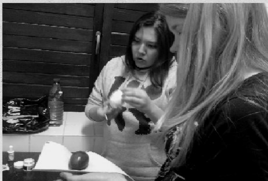
Tojás festés! :)